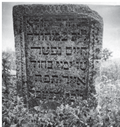
Iehuda Leib fiul lui Chaim, cimitirul evreiesc Ciurchi, Iași, 1725 Iehuda Leib, son of Chaim, the Jewish cemetery from Ciurchi, Iași, 1725