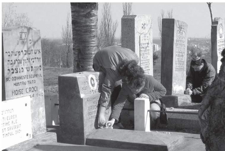
tineri evrei respectând memoria celor morți Young Jews keeping the memory of the departed