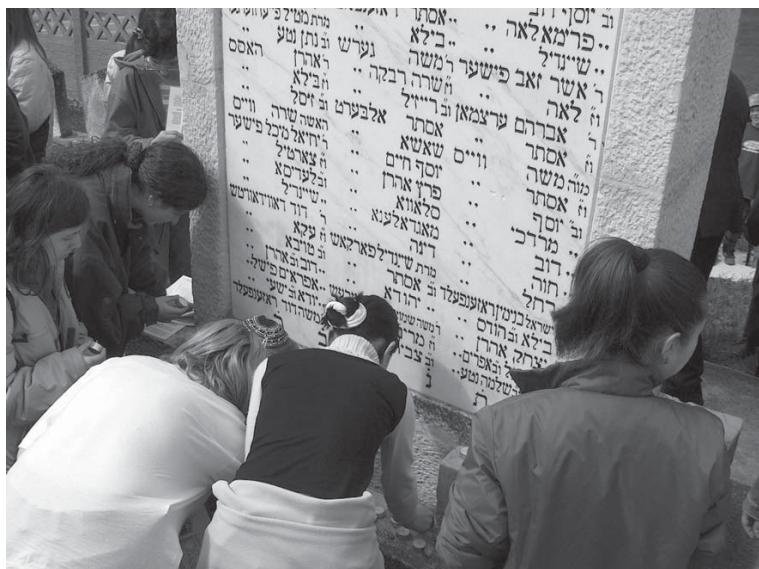
locuri în care tăcerea înseamnă respect, iar lumina aducere aminte - Sarmaș places where silence means respect, and light means remembrance